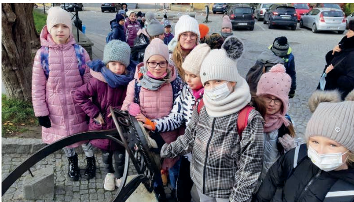
Z wizytą w Sandomierzu.

Wycieczkę zorganizowano w ramach projektu „Poznaj Polskę” ze środków Ministerstwa Edukacji i Nauki, na mocy porozumienia z Gminą Piekoszów. /SP w Jaworzni/