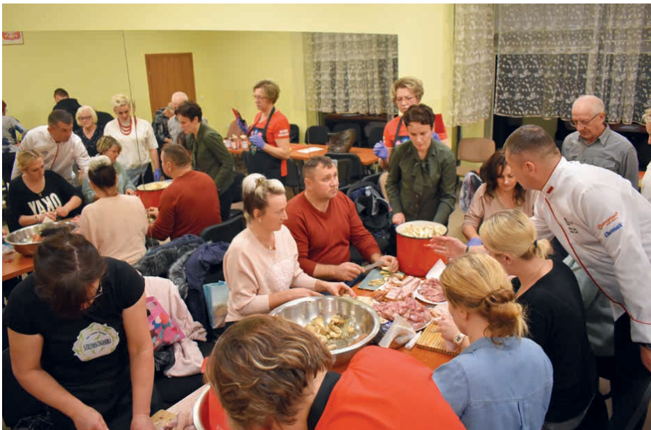
Warsztaty w Wincentowie zgromadziły osoby z różnych stron województwa świętokrzyskiego.

Podczas warsztatów przygotowali karpia w szarym sosie po staropolsku – sos był na bazie mąki gryczanej. Oprócz tego był jarmuż duszony na maśle, z jogurtem i jajkiem na twardo oraz gotowana i pieczona rzepa z pietruszką i koprem. Stworzona została także surówka z rzepy z jogurtem,