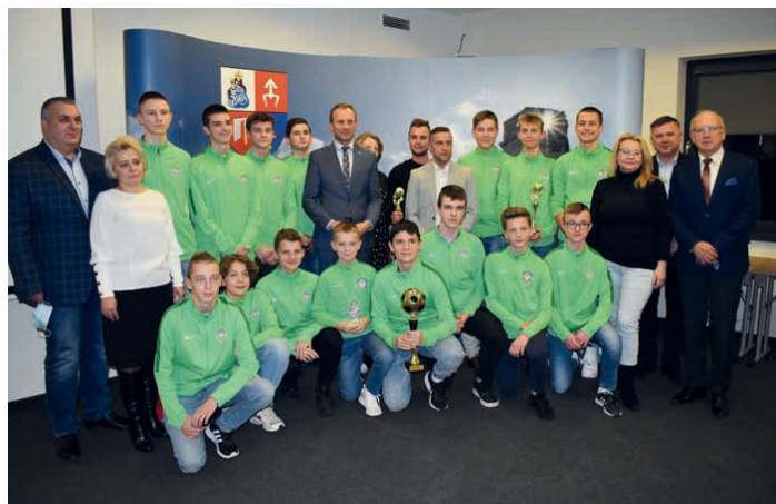
Drużyna 4Eco Astra Piekoszów rocznik 2007.

Zawodnicy otrzymali pamiątkowe puchary, statuetki i nagrody. /kcz/