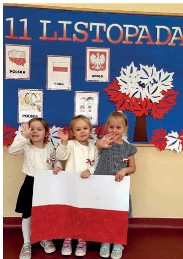
Przedszkolaki już znają polskie symbole narodowe.