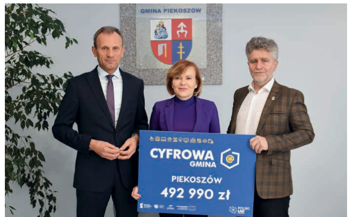
Gmina polepszy swoje usługi dzięki wsparciu „Cyfrowej gminy”.