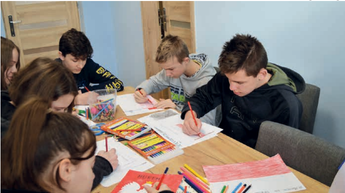
Uczniowie wykonali prace plastyczne.