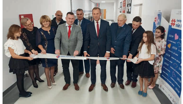
Uroczyste otwarcie szkoły po remontach i termomodernizacji.

Oprócz wystąpień uczniów, zaproszonych gości i przecięcia wstęgi, w tym dniu odbyła się również ślubowanie klas pierwszych. /kcz/