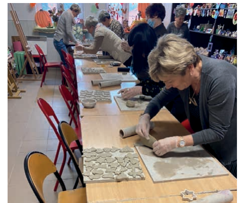
Seniorzy podczas działań.