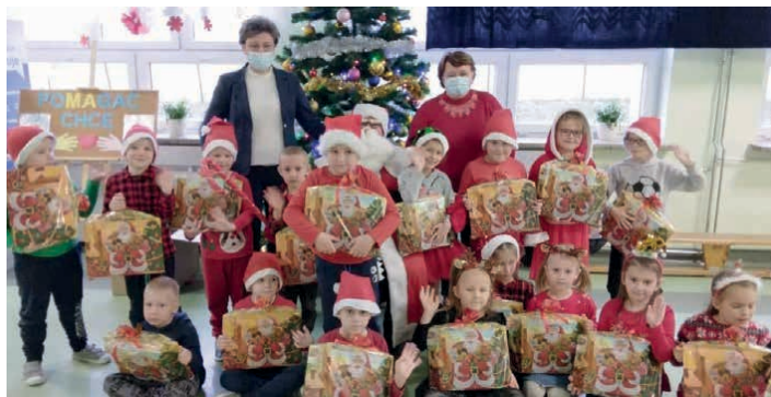
Mikołaj w szkole w Rykoszynie.