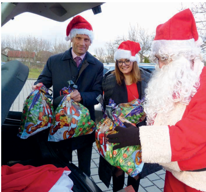
Prezenty trafiły do wyczekujących Mikołaja dzieci.