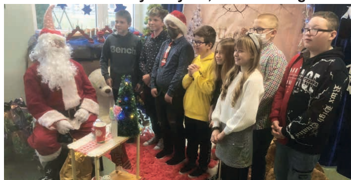
Wizyta Świętego Mikołaja w Micigoździe.