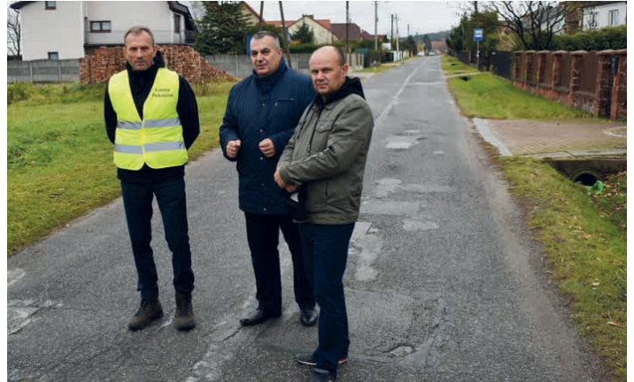
Z wizytą na drodze w Łaziskach.