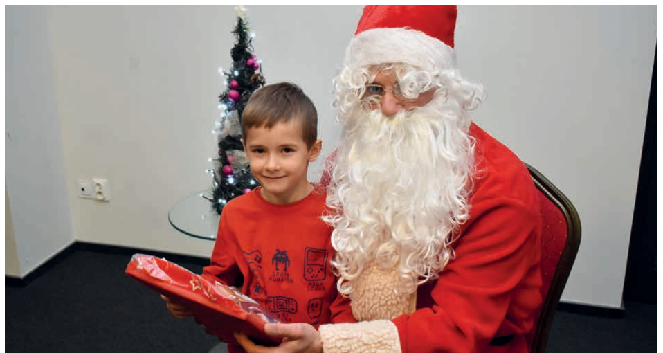
Każde z dzieci z rąk Świętego Mikołaja otrzymało prezent.

Na zakończenie miłego spotkania dzieci obiecały być grzeczne przez cały rok. /kcz/