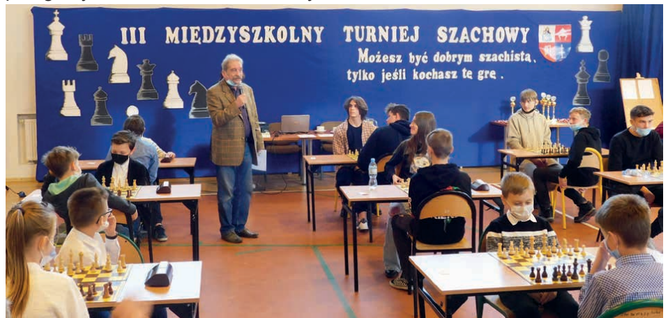
W turnieju szachowym wzięło udział kilkudziesięciu zawodników.