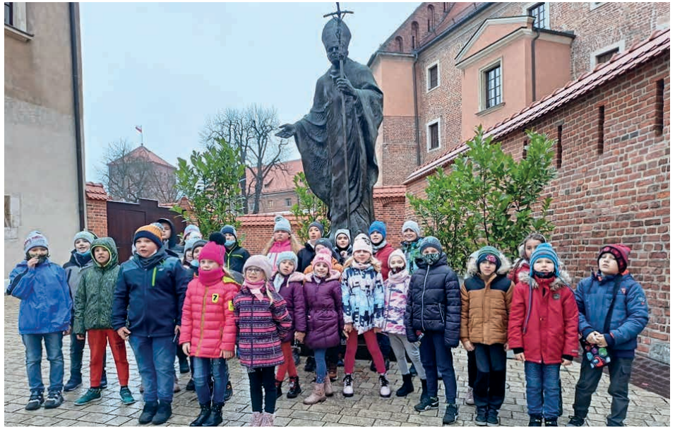
Z wizytą w Krakowie.

Z kolei starsze klasy zwiedzanie królewskiego miasta rozpoczęli od Katedry Wawelskiej. Podziwiając