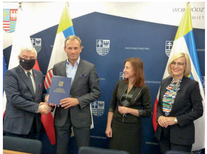
Umowa na stworzenie pracowni wraz z wyposażeniem podpisana.