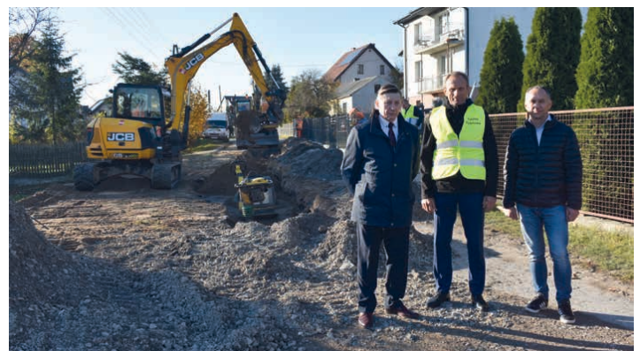
Budowa kanalizacji i drogi w Janowie.

To dokładnie tak jak w sporcie. Przede wszystkim trzeba umieć dobrać sobie kadrę dobrych pracowników w kluczowych dziedzinach, bo przecież żaden wójt ani burmistrz nie zna się idealnie na wszystkim. To po pierwsze, a po drugie sportowcy są nauczeni pracy na najwyższych obrotach, ale też wiedzą kiedy należy odpuścić, zregenerować siły i powrócić z ich zdwojoną mocą. W samorządzie trzeba też znać granice, trzeba wiedzieć kiedy odpuścić pewne rozmowy i kiedy do nich powrócić, bo bez dobrej współpracy i umiejętności negocjacyjnych z licznymi parlamentarzystami i samorządowcami wyższego szczebla, którzy nas mocno wspierają i widzą potrzeby naszej gminy, nie mielibyśmy w budżecie dodatkowych kilkunastu milionów złotych tylko w tym roku i nie mielibyśmy tylu zrealizowanych inwestycji.