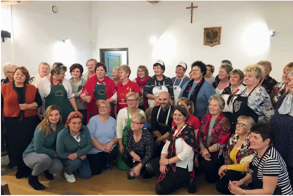
Pierwsze warsztaty w ramach projektu odbyły się w województwie małopolskim.

kaszotto z mieszanki kasz z soczewicą, dynią i jarmużem, a z topinamburu przyrządzono purę, a także pyszną sałatkę z kiszonych bulw.