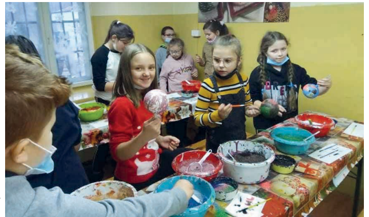
W rękach uczniów powstały piękne świąteczne bombki.