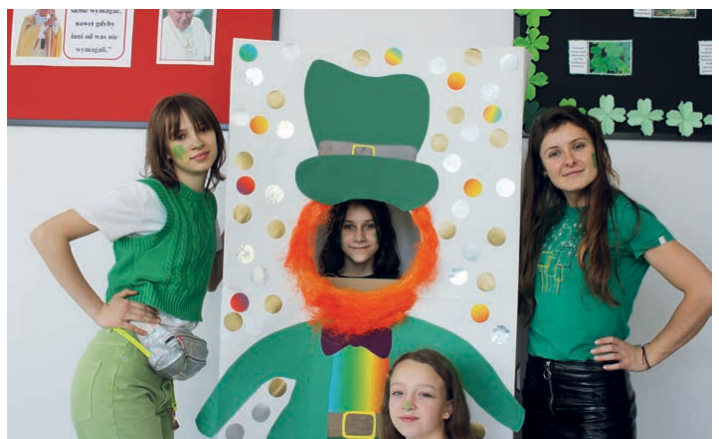
Święto św. Patryka w Jaworzni.