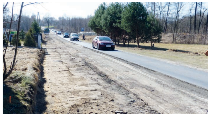
Natężenie ruchu na drodze powiatowej prowadzącej przez Szczukowice jest bardzo duże.