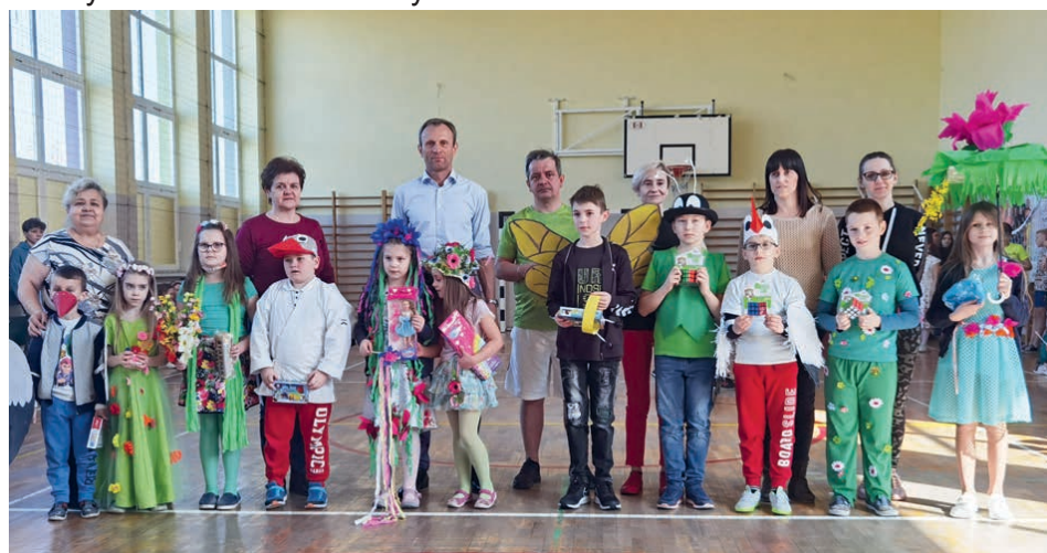
Kolorowe stroje, zawody, rywalizacja - tak wyglądał pierwszy dzień wiosny w Brynicy.