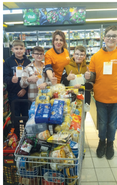
Świąteczna Zbiórka Żywności zakończyła się sukcesem. Zebrano ponad 200 kg produktów spożywczych i higienicznych.