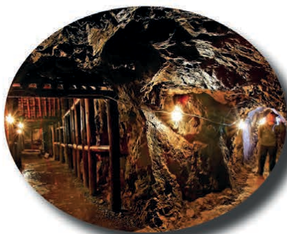
Kopalnia złota w Złotym Stoku

Informacje, zapisy, opłaty: Biblioteka w Piekoszowie ul. Częstochowska 66 I piętro (Administracja) tel.: 41 306 11 83 lub 570 103 042