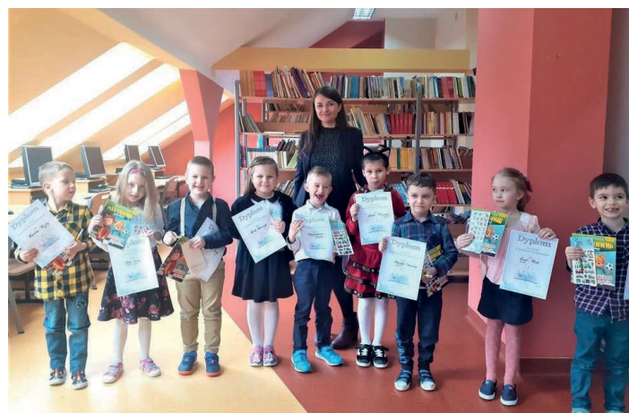
Szkolne dni profilaktyki i uzależnień nie ominęły także przedszkolaków.