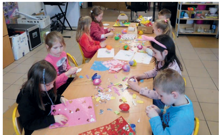
Dzieci podczas zajęć kreatywnych tworzyły ozdoby świąteczne.