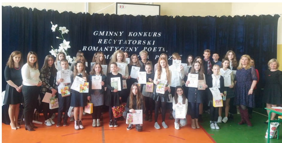
Laureaci konkursu recytatorskiego w szkole w Rykoszynie.