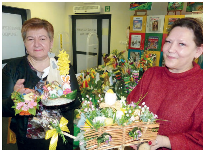
Podczas kiermaszu zakupić można było wiele ozdób wielkanocnych.

Trzeba przyznać, że wszystkie ozdoby, jakie były dostępne podczas kiermaszu, wykonano starannie, z wielkim zaangażowaniem i pomysłowością. Mając na stole jedną z takich ozdób, z pewnością stały się one radośniejsze. /kcz/