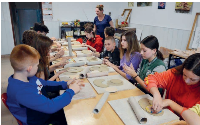
Podopieczni świetlicy środowiskowej tworzyli prezenty dla rodziców.