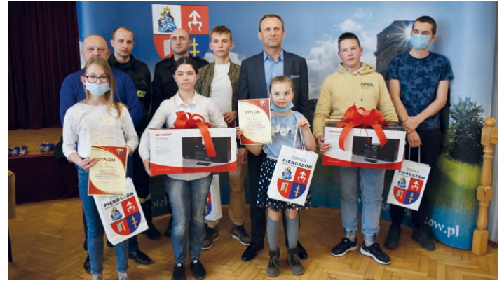
Najlepsi uczestnicy konkursu pożarniczego.

Zwycięzcy poszczególnych kategorii będą reprezentować gminę w turnieju powiatowym i – jeśli przejdą dalej – w turnieju wojewódzkim, a potem ogólnopolskim. Wszyscy laureaci otrzymali atrakcyjne nagrody ufundowane przez wójta gminy Piekoszów. /kcz/