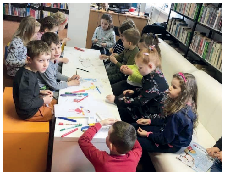
Wiosenna wizyta dzieci w bibliotece w Zajęczkowie.