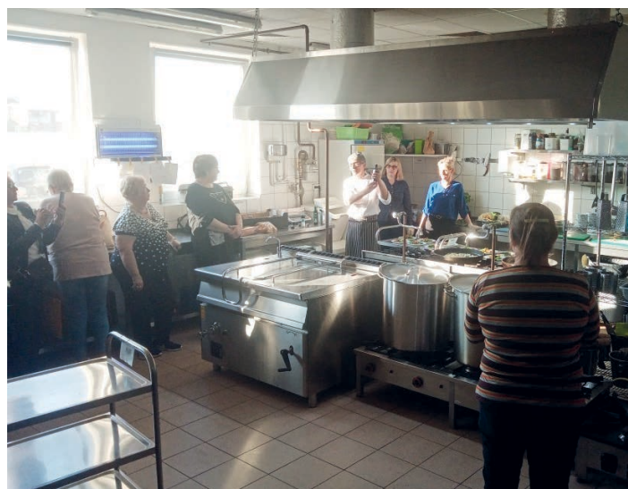
Smakowite potrawy powstały podczas warsztatów w Cekcynie.

cukrem i orzechami nerkowca i coulis (sos) z malin. Tutaj do elementów fit możemy zaliczyć brązowy cukier degamera, naturalne couli z malin oraz obróbkę termiczną, czyli pieczenie na klarowanym maśle. /kcz/