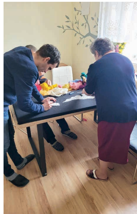
Podopieczni ŚDS są bardzo aktywni.

Zgodnie z planem, do końca bieżącego roku powinien zostać wykonany pierwszy etap, czyli zamknięcie budynku w stanie surowym. /kcz/