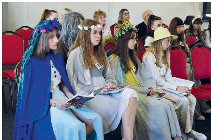
Uczniowie prezentowali także Miniaturę sceniczną.