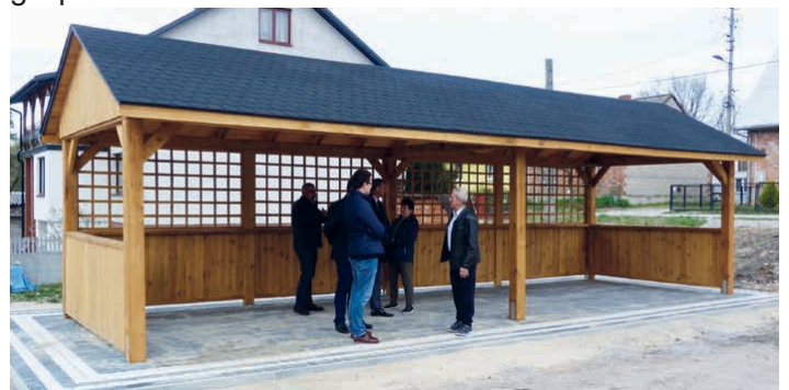
Obszerna altana będzie służyć mieszkańcom Zajączkowa. (fot. CKInfo)