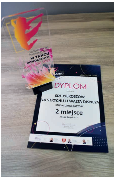
Statuetka oraz pamiątkowy dyplom powędrowały do tancerek ze Studio Dance Factory z Piekoszowa podczas ogólnopolskiego konkursu tanecznego.