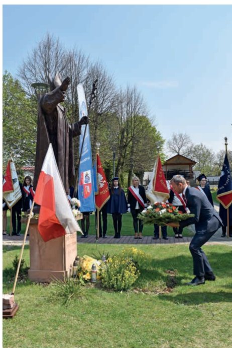
Złożono także wieńce przy pomnikach Św. Jana Pawła II i bł. kard. Stefana Wyszyńskiego.