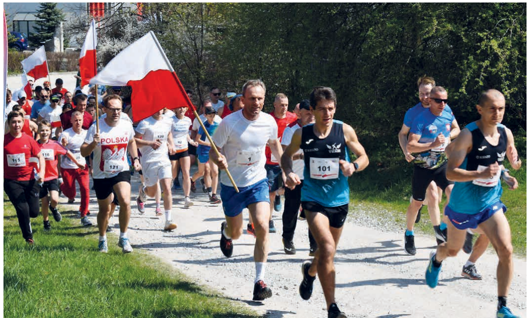
W biegu wystartowało blisko 100 osób.

– W organizacji biegów wsparli nas: Zakład Piekarni-