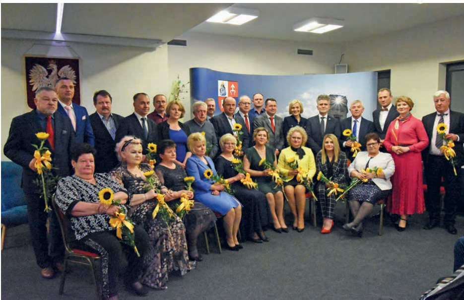
Gminny Dzień Sołtysa.