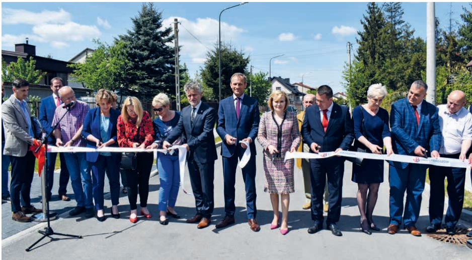
Ulica Żeromskiego w Piekoszowie została uroczystie otwarta.

Małgorzata Pietrzykowska Radna Gminy Piekoszów