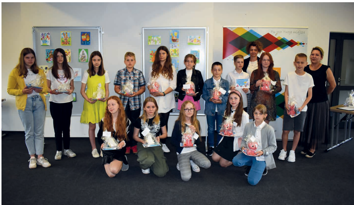
Laureaci konkursu plastycznego „Kartka wielkanocna” w kategorii klas IV-VI.