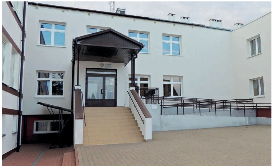
Część sportowa szkoły w Zajączkowie przejdzie termomodernizację.

Termomodernizacja szkoły w Zajączkowie będzie możliwa dzięki pozyskanemu dofinansowaniu ze środków Unii Europejskiej na projekt „Zwiększenie efektywności budynków użyteczności publicznej w Gminie Piekoszów (Etap II)”. Projekt współfinansowany jest z Europejskiego Funduszu Rozwoju Regionalnego w ramach Działania 6.1 „Efektywność energetyczna w sektorze publicznym – ZIT KOF” Osi 6 „Rozwój miast” RPO WŚ na lata 2014-2020. – Cieszmy się tym, że następną szkołą na terenie gminy Piekoszów zostanie termomodernizowana w ramach tak dużego, wielomilionowego projektu, dzięki któremu sukcesywnie, jak dotąd, zmienialiśmy placówki użyteczności publicznej w miejsca oszczędne i nowoczesnie wyglądające. Bo termomodernizacja to nie tylko nowy wygląd, ale i szereg prac mających na celu generowanie mniejszych kosztów utrzymania pla-