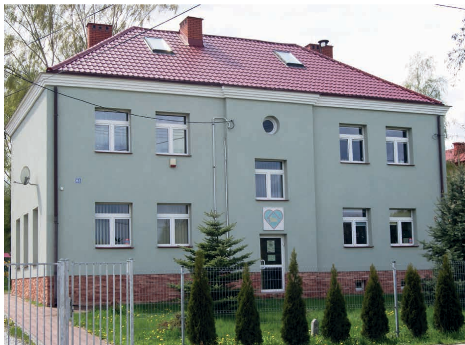
Środowiskowy Dom Samopomocy zyska nowy budynek.