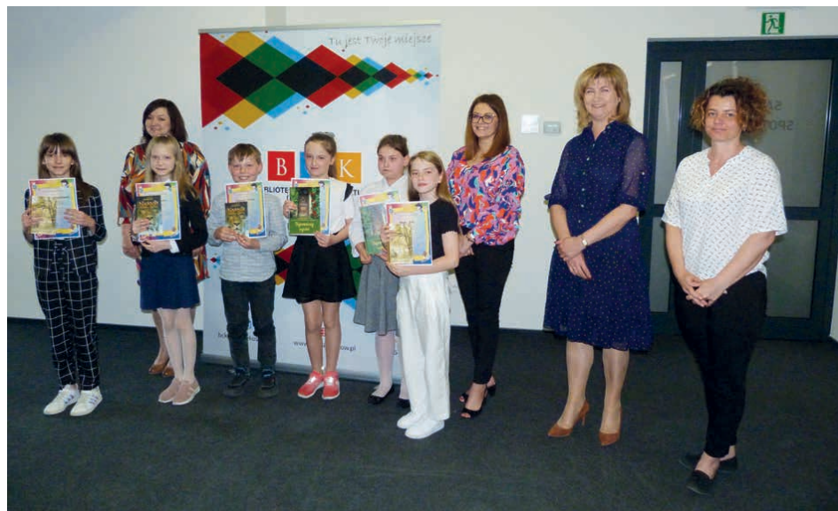
Laureatom wręczono nagrody książkowe i dyplomy.