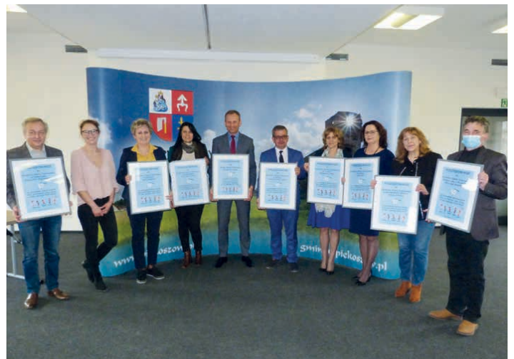
W Piekoszowie podsumowano akcję profilaktyki stomatologicznej. W sumie przebadanych zostało ponad 1000 dzieci.