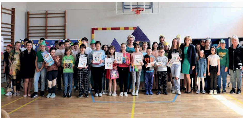
Wiele ciekawych informacji o ziemi zdobyli uczniowie szkoły w Jaworzni.