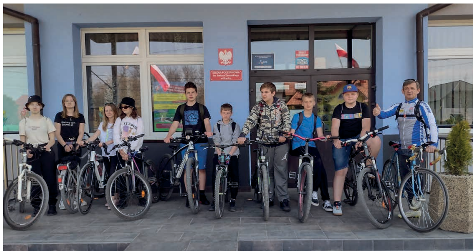
Grupa uczniów ze szkoły w Brynicy uczciła święto flagi... na rowerach.