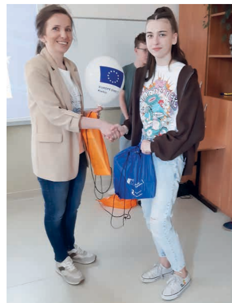
Przedstawicielka Europe Direct Kielce wręczyła nagrody w konkursie.