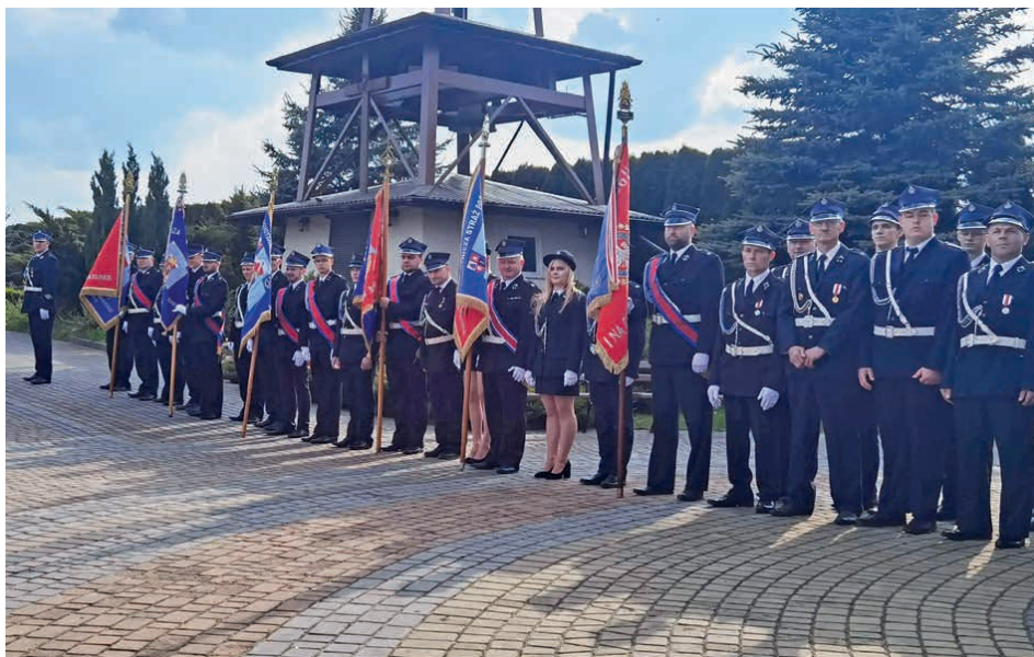
Strażacy z gminy Piekoszów świętowali w tym roku w Szczukowicach.

„Głos Piekoszowa” miesięcznik bezpłatny samorządu gminy Piekoszów