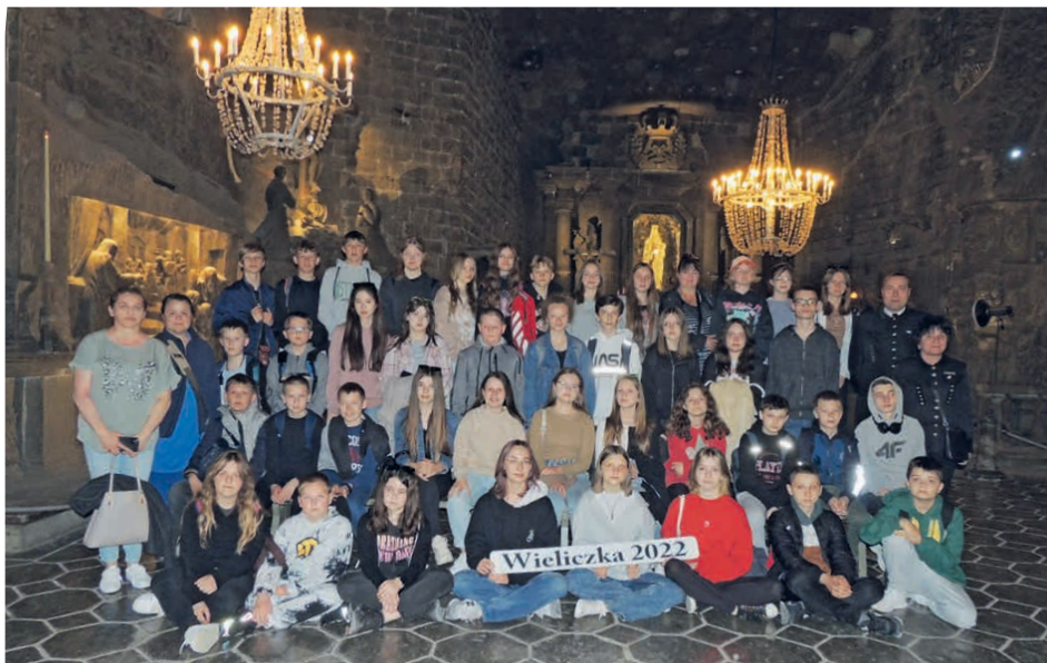
Uczniowie z Zajączkowa z wizytą w Wieliczce.