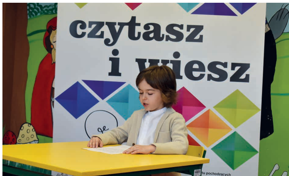
Uczniowie mieli za zadanie przeczytać wylosowany fragment tekstu.