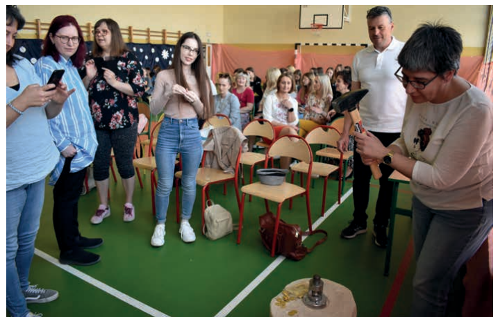
Z wizytą w szkole w Rykoszynie. Wybijanie pamiątkowej monety z wizerunkiem Marszałka Józefa Piłsudskiego.