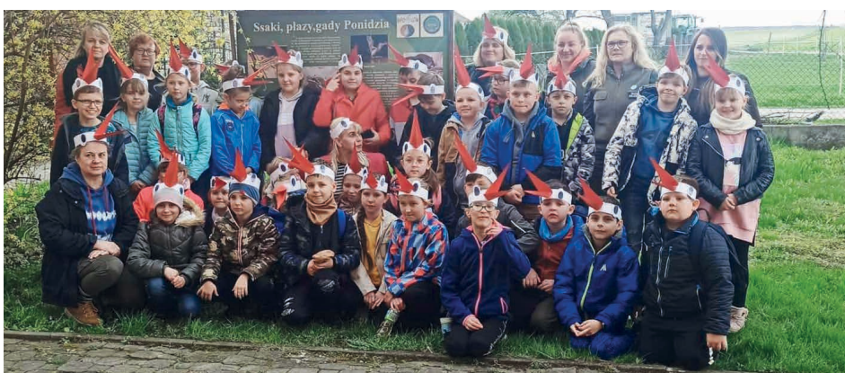
Uczniowie z Micigózdzie zwiedzili Ponidzie.