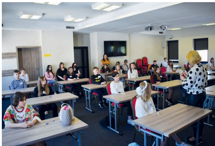
Pierwsze dwa etapy konkursu - ustny i pisemny - dotyczyły znajomości „Balladyny” i twórczości oraz życia Juliusza Słowackiego.