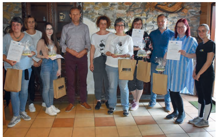
Zagraniczni goście brali udział w grze terenowej.