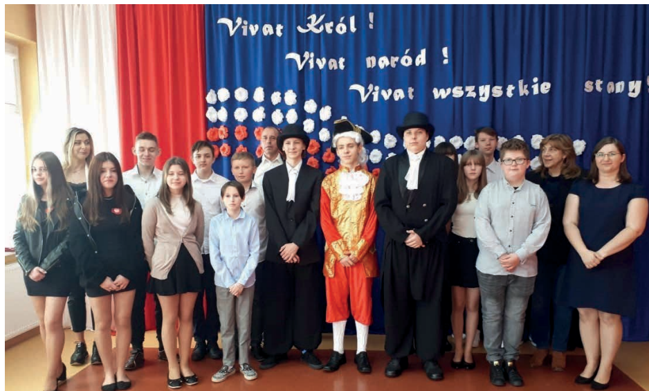
Świętowanie obchodów uchwalenia Konstytucji 3 Maja.