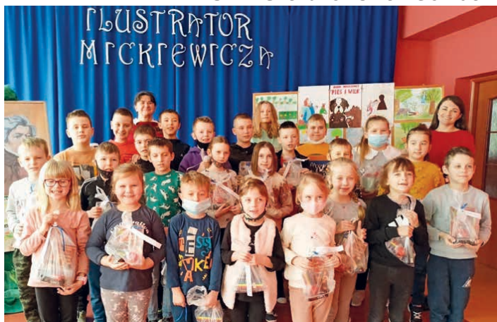
Najlepsi ilustratorzy Mickiewicza.