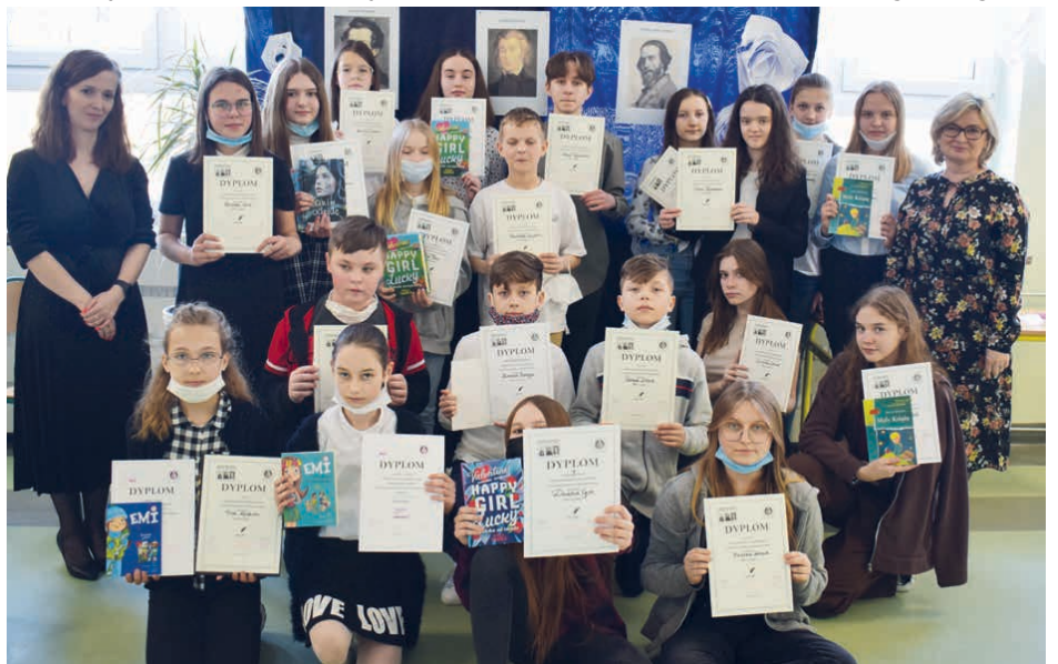
Uczestnicy i laureaci konkursu recytatorskiego.