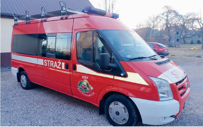
Strażacy ze Szczukowic sami przystosowali nowe auto do potrzeb pojazdu strażackiego.

Druhowie z OSP w Szczukowicach przy wsparciu finansowym gminy Piekoszów, zakupili uprzywilejowany samochód marki Ford Transit i sami przystosowali go do potrzeb pojazdu strażackiego.