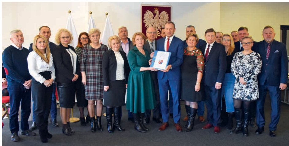
Już 1 stycznia 2023 roku Piekoszów może stać się miastem.