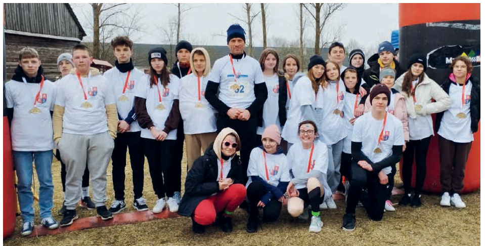
Reprezentanci gminy Piekoszków podczas Biegu Wilczym Tropem w Tokarni.