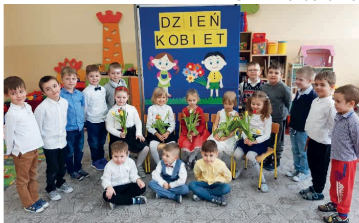
Przedszkolaki z życzeniami dla kobiet - dużych i małych.