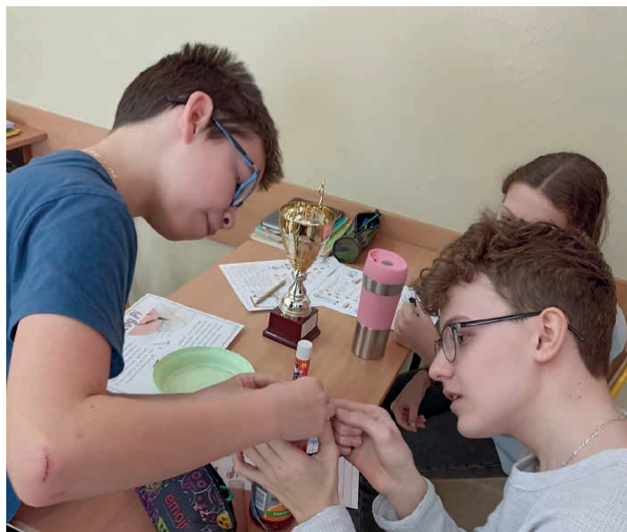
Uczniowie przekonali się, że matematyka jest wokół nas.

Mogli się o tym przekonać uczniowie szkoły podstawowej w Łosieniu. Obchody matematycznych świąt rozpoczęły się od pogadanki dotyczącej historii liczby \pi oraz od poznania ciekawostek z nią związanych. Następnie uczniowie zmierzali się z zagadkami Biura Detektywistycznego Królowej Matmy oraz wykonywali doświadczenie, mające na celu wyznaczenie przybliżonej wartości liczby \pi . Działania te wykonywane były z dużym zapałem i sprawiły wszystkim dużo radości. /SP w Łosieniu/