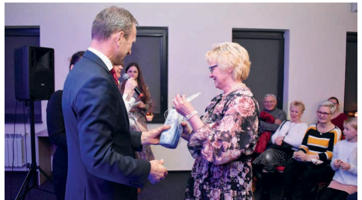
Na zakończenie rozlosowano vouchery na zabiegi oraz karnety.