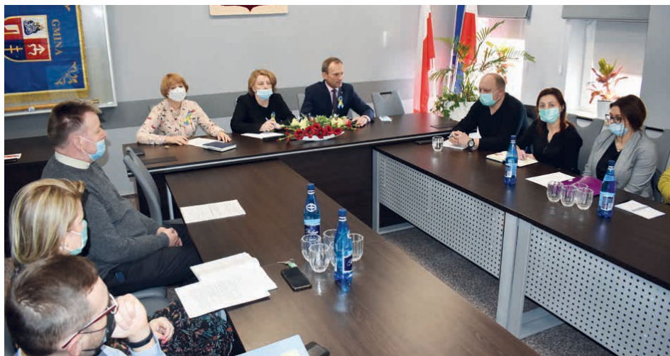
Gminny sztab kryzysowy podjął konkretne kroki w związku z sytuacją na Ukrainie.

Dziękuję za rozmowę Katarzyna Czerwińska