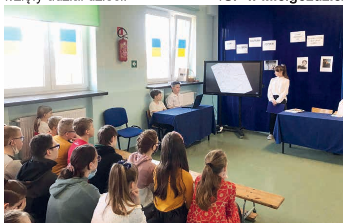
O twórczości Adama Mickiewicza mówiono w Micigoździe.