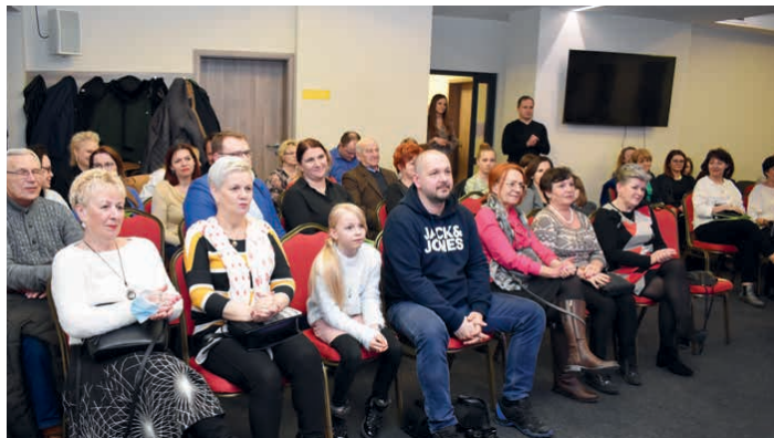
Publiczność śpiewała razem z artystami.

Koncert nie był jedyną niespodzianką przygotowaną