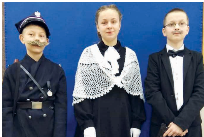
Konkurs na prezentację wybranego bohatera.