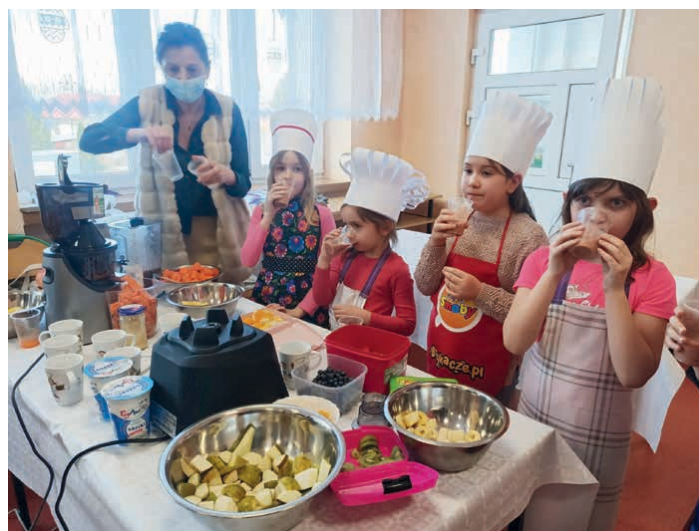
Uczniowie robią pyszne i zdrowe soki warzywno-owocowe.