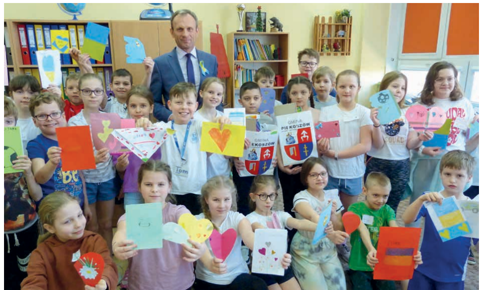
Uczniowie z Piekoszowa przywitani nowych uczniów w wyjątkowy sposób.