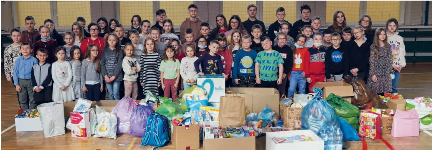
Uczniowie z Brynicy stanęli na wysokości zadania i pokazali ogromne serce i chęć pomocy Ukrainie.