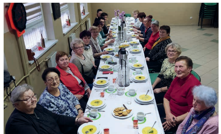
Uczestniczki warsztatów w Suchodańcu (woj. opolskie).

W czwartek 17 marca w świetlicy wiejskiej w Suchodańcu, województwo opolskie, zorganizowane zostały kolejne warsztaty „EtnoFit na talerzu”. Liczna grupa przybyłych Pań przyszykowała zdrowe zielone sałatki, pulpeciki czy zupę krem. Wszystko z fit akcentem. Trzeba przyznać, że zaangażowanie Pań było bardzo widoczne, czego dowodem były smakowite dania, które stworzyły. Jak widać, przyjemność i nauka czegoś nowego może iść ze sobą w parze.