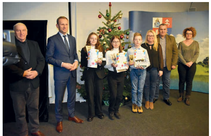
Laureaci czytelniczej grywalizacji.

Dofinansowano ze środków Ministra Kultury i Dziedzictwa Narodowego pochodzących z Funduszu Promocji Kultury