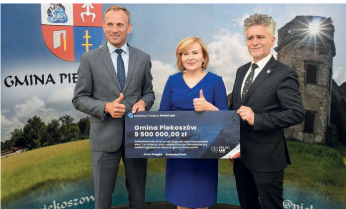
Pozyskano 9,5 mln złotych na zniwelowanie strat wody poprzez opomiarowanie sieci i przyłączy oraz modernizację infrastruktury wodociągowej.