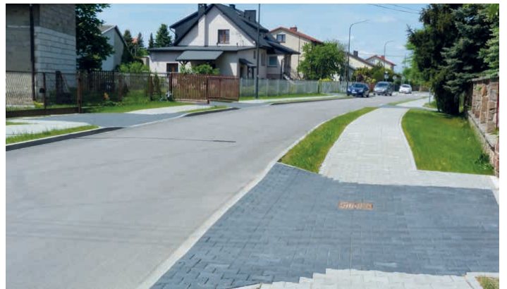
Uroczyste otwarto wyremontowane ulice: Żeromskiego (na zdjęciu), Reja i Witosa w Piekoszowie.