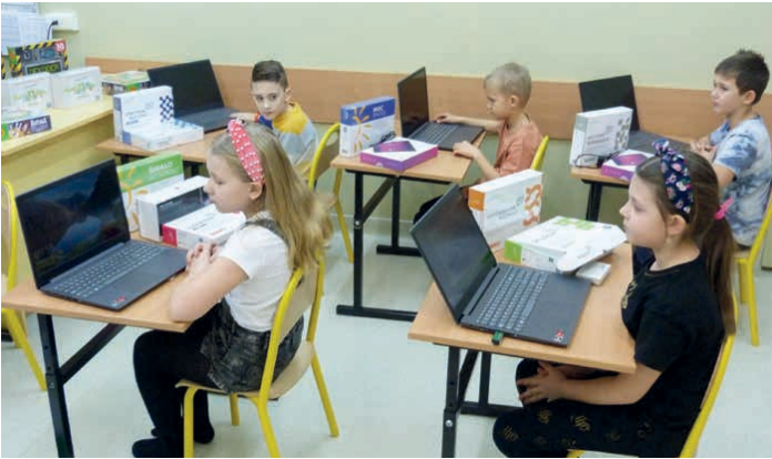
Innowacyjny sprzęt trafił do szkół na terenie gminy Piekoszów w ramach projektów „Aktywna tablica” czy „Laboratoria przyszłości”.