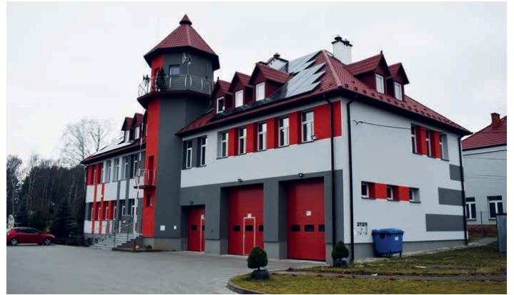
Zakończyła się termomodernizacja centrum kultury w Piekoszowie przy ul. Częstochowskiej 85a.