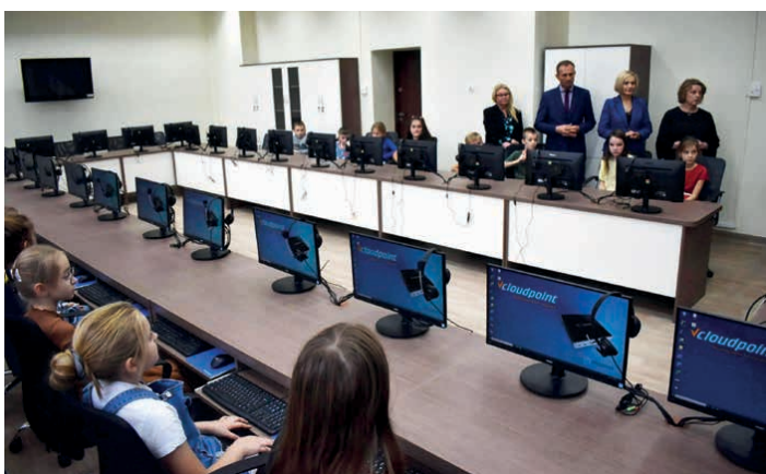
W szkole w Piekoszowie otwarto nowoczesne pracownię informatyczne.