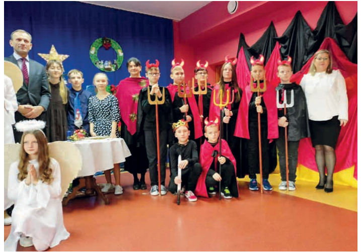
Uczniowie doskonale wprowadzili wszystkich w bożonarodzeniowy klimat.

W doborowej obsadzie klasy VI i przy pomocy niektórych uczniów klasy IV oraz zacnych gości tak przeżywaliliśmy tegoroczne Jasełka. Można było się i wzruszyć, i pośmiać, był to prawdziwy teatralny występ, nagrodzony gromkimi brawami. /SP w Szczukowskich Górkach/