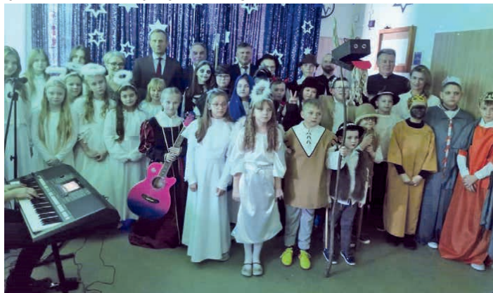
Uczniowie przybliżyli historię Bożego Narodzenia. (fot. ZOPI Micigoźd)

Tuż przed świętami Bożego Narodzenia w szkole odbyły się również jasełka i Wigilia, które wprowadziły nas w uroczysty nastrój. Uczniowie zaprezentowali