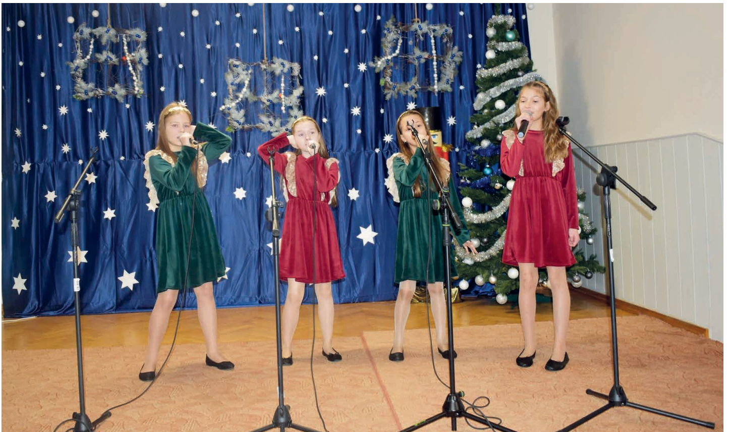
Konkurs kolęd i pastorałek cieszył się dużym zainteresowaniem. Młodzi wokaliści występowali solo, w duetach lub grupach.