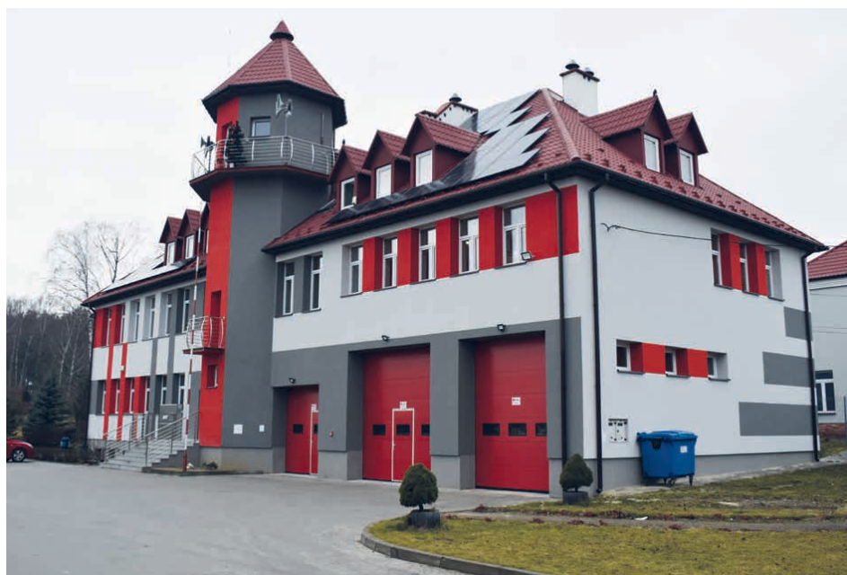
Budynek BCK w Piekoszowie przy ul. Częstochowskiej 85a.