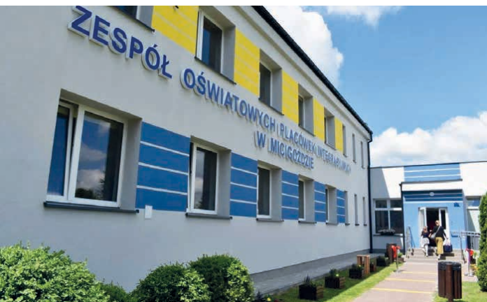
Zakończono termomodernizację Zespołu Oświatowych Placówek Integracyjnych w Micigoździe.