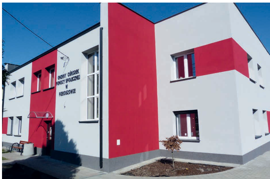
Gminny Ośrodek Pomocy Społecznej w Piekoszowie.