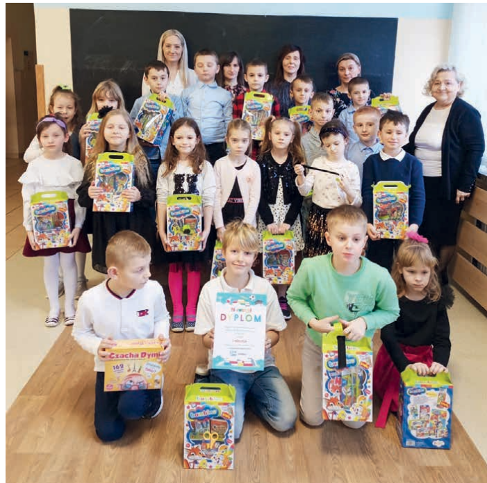
Najsympatyczniejsze pierwszaki w naszym województwie.

szych w temacie bezpieczeństwa oraz propagowania zdrowego i higienicznego stylu życia. /SP w Brynicy/