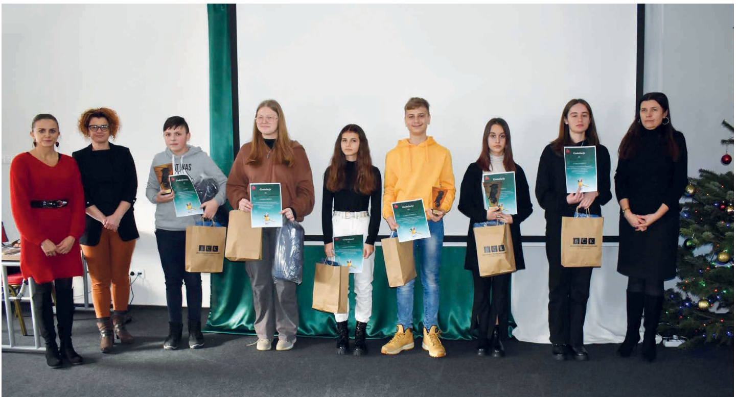
Najlepsi „Matematykomania” w gminie Piekoszów.

Najlepsi otrzymali nagrody rzeczowe i statuetki. /kcz/