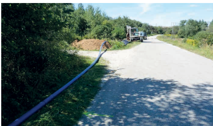
Rozpoczęła się budowa wodociągu w Gałęzicach.