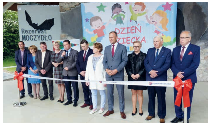
Podczas Dnia Dziecka w Jaworzni, uroczyste otwarto ścieżki dydaktyczne w Rezerwach Moczydło i Chelosiowa Jama.