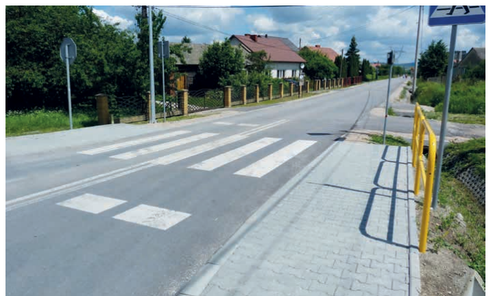
Otwarto przebudowane ulice Słoneczną (na zdjęciu) i Południową w Micigoździe.