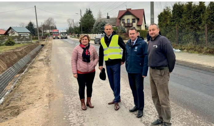
Ruszyła budowa drogi w Szczukowicach, na którą pozyskano 3 miliony złotych rządowego dofinansowania.