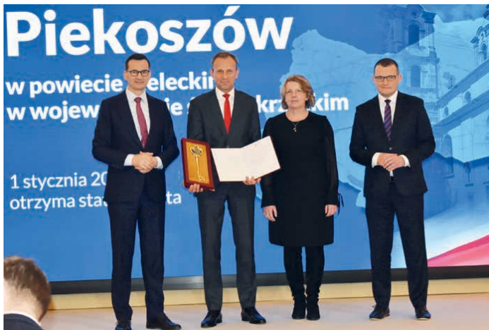
Dekret o nadaniu praw miejskich wręczył Premier Mateusz Morawiecki.

Piętnaście nowych miast, jakie już z dniem 1 stycznia 2023 roku pojawiły się na mapie Polski, prawa miejskie odzyskała po latach, a część z nich status ten uzyskała po raz pierwszy w historii. Tak było w przypadku gminy Piekoszów. Propozycja zmiany statusu na miejski uzyskała pozytywną opinię Rady Gminy, a nadanie statusu miasta było poprzedzone konsultacjami społecznymi z mieszkańcami.