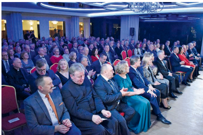
Noworoczna gala zgromadziła dużą publiczność i znakomitych gości.