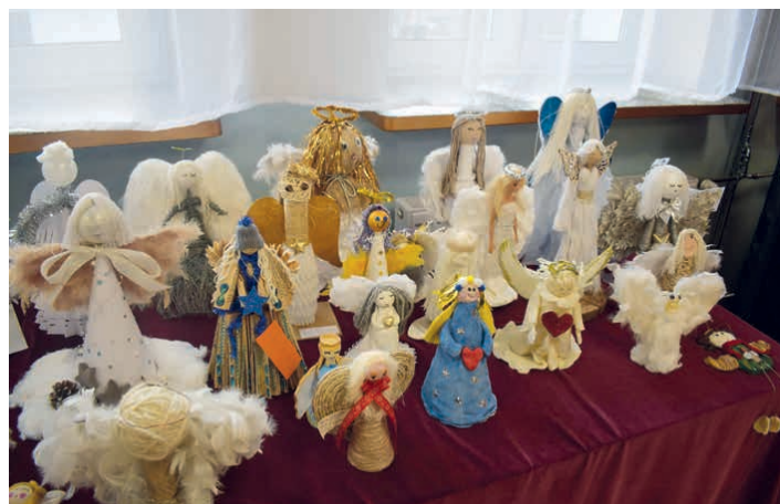
Na konkurs zgłoszonych zostało blisko 120 aniołów.