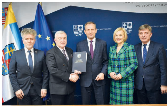
Umowa na termomodernizację szkoły w Piekoszowie podpisana.