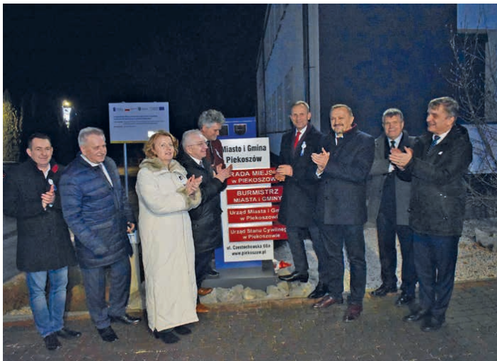
Piekoszów od 1 stycznia jest miastem.

Premier Mateusz Morawiecki zaznaczył, że status miasta to powód do dumy, ale również zobowiązanie, aby miasto się rozwijało. – Sercem każdego miasta nie jest rynek, ale tym najważniejszym sercem są ludzie – mówił premier Mateusz Morawiecki. Jak podkreślił, nowe miasta powinny przyciągać nowych inwestorów, przedsiębiorców, tworzyć nowe miejsca pracy.