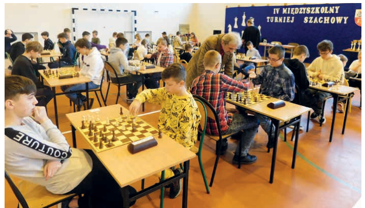
Turniej szachowy cieszył się bardzo dużym zainteresowaniem.

W pierwszej kategorii wiekowej (klasy III-V) zwyciężył Patryk Surma ze szkoły w Brynicy. Tuż za nim