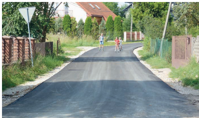
Janów zyska nową drogę oraz kanalizację. Na tę inwestycję mieszkańcy czekali kilkadziesiąt lat.