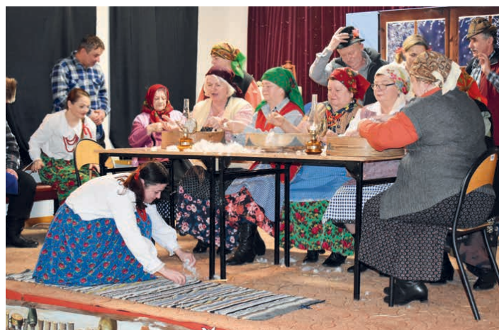
Stowarzyszenie Piekoszowianie zwyciężyło w przeglądzie.