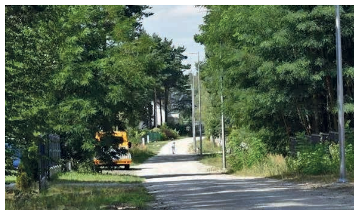
Ulica Lawendowa w Piekoszowie zyskała nowe oświetlenie.