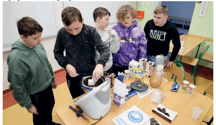
Uczniowie korzystali z urządzeń zakupionych ze środków rządowych.

Wśród zimowej przedświątecznej aury królowała również gorąca czekolada wykonana przez naszych przedszkolaków i uczniów klasy VI. Dzieciaki z pomocą nauczycieli wykorzystali thermomixa i przygotowali przepyszna gorącą czekoladę. Wszyscy zaangażowani byli w pracę. Każdy miał swoje zadanie do wykonania. Zapach czekolady unosił się w całej sali. Na koniec uczniowie wraz z nauczycielem delektowali się przepyszna gorącą czekoladą. Było smacznie. /SP w Jaworzni/