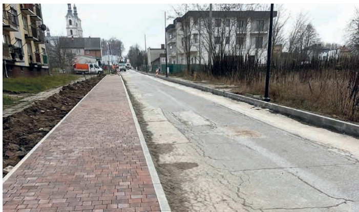
Przebudowa ulicy Zacisznej (w kierunku cmentarza parafialnego) w Piekoszowie.