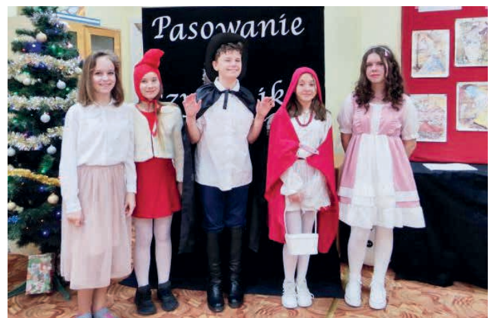
O część artystyczną pasowania zadbał uczniowie ze starszych klas.

zostały przygotowane przez Instytut Książki w ramach kampanii „Mała książka – wielki człowiek”, której strategicznym celem jest rozwój czytelnictwa wśród dzieci w różnych grupach wiekowych. Projekt zrealizowany został ze środków Ministerstwa Kultury i Dziedzictwa Narodowego pod patronatem Ministerstwa Edukacji Narodowej. /SP w Piekoszowie/