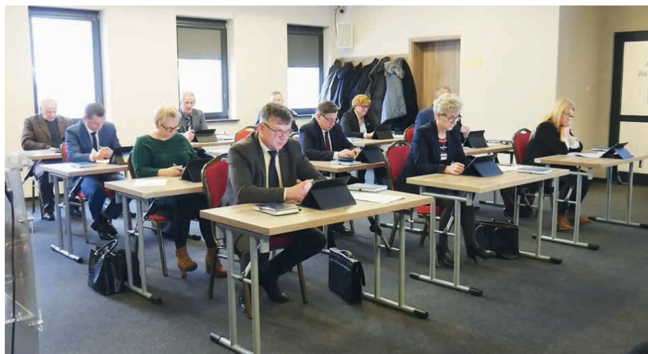
Radni zdecydowaną większością głosów przyjęli budżet na 2023 rok.

– Pod względem ekonomicznym 2023 rok będzie trudnym rokiem. Patrząc na przyszłoroczny projekt budżetu bardzo wzrosły wydatki bieżące w stosunku do obecnego roku. Jest to związane przede wszystkim ze wzrostem cen i usług, z podwyżką wynagrodzenia minimalnego, ze wzrostem cen energii cieplnej i elektrycznej, a także ze wzrostem kwoty wozokilometra w transporcie zbiorowym. Wszystkie te rynkowe czynniki sprawiły, że znacznie wzrosły wydatki bieżące, a zmniejszyła się nadwyżka budżetowa, która we wcześniejszych latach kształtowała się na wysokim poziomie. Budżet, jaki przedstawiłem jest budżetem o rekordowych wydatkach blisko 110 mln złotych, z czego zaplanowana na inwestycje kwota jest również rekordowa, a wynosi ona 38 mln złotych i stanowi 34 procent całego budżetu. Nadal stawiamy na rozwój infrastruktury drogowej, kanalizacyjnej i wodociągowej, termomodernizację budynków, ale też na budowę obiektów kubaturowych. W pierwszej kolejności będziemy realizować te zadania, na które pozyskaliśmy dofinansowanie rządowe czy unijne. Tylko w ostatnim czasie udało nam się pozyskać