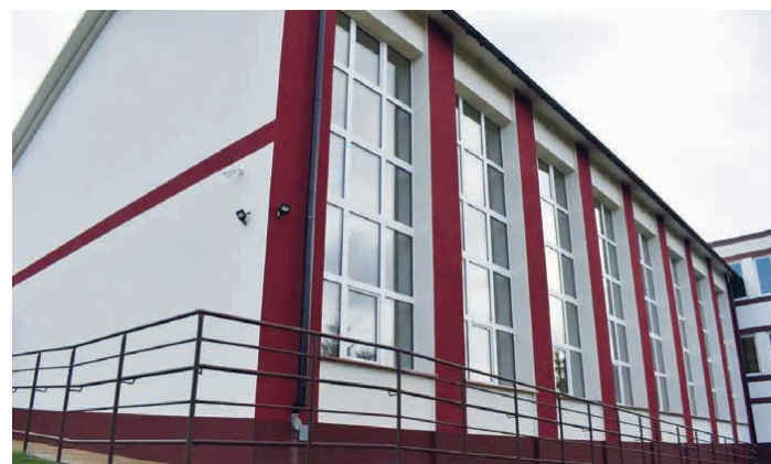
Szkoła w Zajęzowie przeszła termomodernizację.