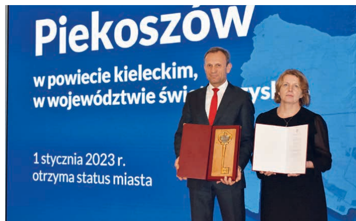
Premier Mateusz Morawiecki wręczył akt nadania praw miejskich dla Piekoszowa i symboliczny klucz do miasta.