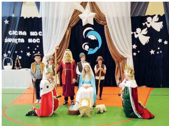
Wyjątkowe jasełka w szkole w Rykoszynie.