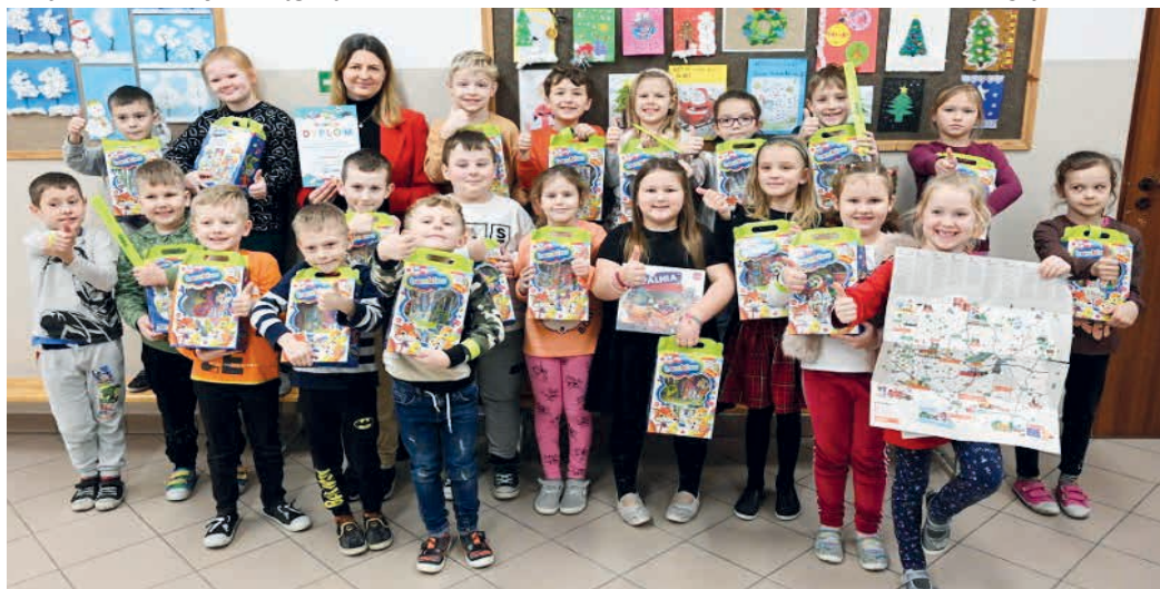
Pierwszaki z Zajączkowa to jedna z najsympatyczniejszych klas w województwie.