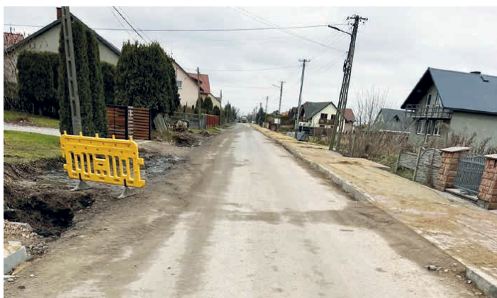
Trwają intensywne prace przy przebudowie drogi w Łaziskach.